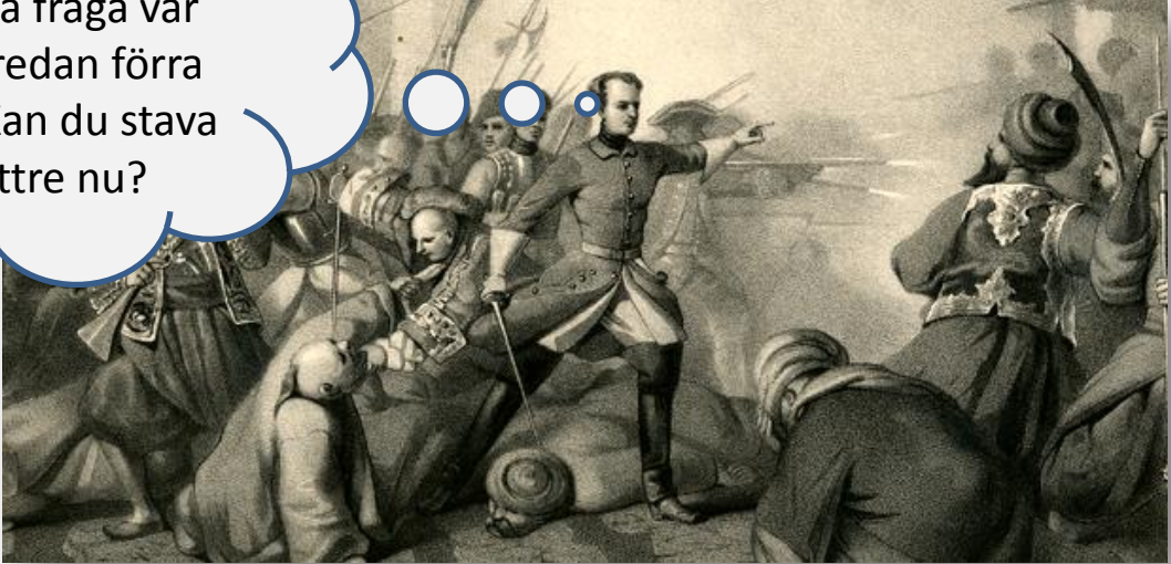
1, X eller 2 i Bender?

Denna fråga var med redan förra året. Kan du stava bättre nu?